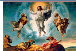
Transfiguración del Señor