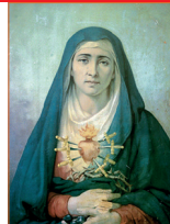
Santísima Virgen Dolorosa del Colegio