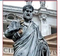
Cátedra de San Pedro