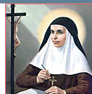
Santa Ángela de la Cruz