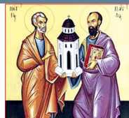
Dedicación de las basílicas de los Santos Pedro y Pablo