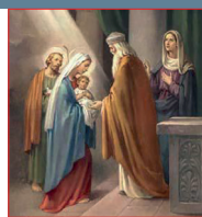
Presentación del Señor